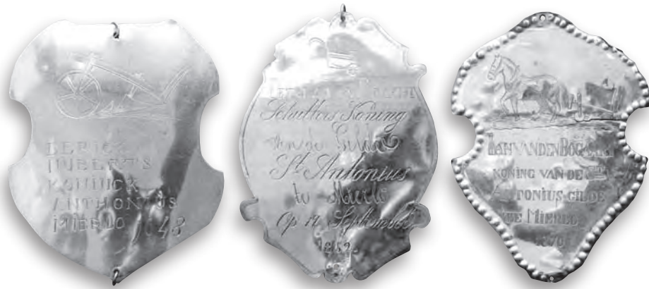
Enkele zilveren gildeschilden uit 1648, 1852 en 1870.