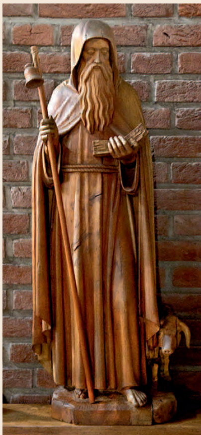
Een prachtig houten beeld van Sint Antonius Abt is te vinden in de Luciakerk.

Antonius werd geboren in 251 in Egypte als kind van rijke ouders. Hij gaf al zijn bezittingen aan de armen en trok zich in eenzaamheid terug. Hij was de eerste monnik die vele volgelingen kreeg en staat daarom bekend als de vader van het kloosterleven. Antonius Abt is te herkennen aan de kluisenaarsstaf en hij is altijd in gezelschap van een varken. Hij werd maar liefst 105 jaar oud. Hij is niet te verwarren met Antonius van Padua die wordt aangeroepen bij zoekgeraakte zaken.