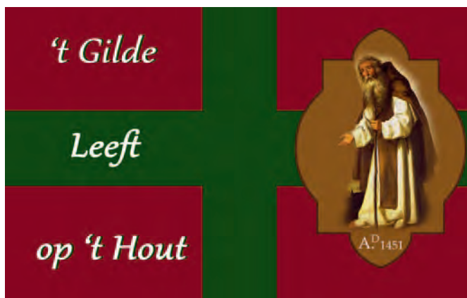
Gildevlag van het Gilde Sint Antonius Abt.

richt ter ere van de heilige Antonius en het gildeverleden. Het eenvoudige kapelletje werd ontworpen door architect Van Grinsven en de bouw kwam voor rekening van aannemer Th. Jansen.