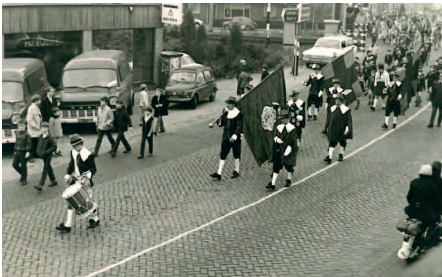
Het Antoniusgilde maakt begin jaren zeventig een tocht door Mierlo-Hout. Hier heeft men zojuist de spoorwegovergang gepasseerd en is op weg naar de Luciakerk.

de handboog beoefend op de zogenaamde schutsboom. Lange tijd bevond de schutsboom zich in het gelijknamige gehucht tussen Mierlo en Mierlo-Hout, tegenwoordig gelegen in Brandevoort. Nog steeds heet het gebied waar eeuwenlang de schutsboom van het Antoniusgilde bevond, 'De Schutsboom'. Ook al is deze sinds 1969 verplaatst naar 'De Beemd' aan de Heeklaan. De schutsboom stond dicht bij de oude hoeve Snepescheut, in het gehucht dat het Lambertseind werd genoemd. Hier stond in de middeleeuwen de oudste kapel van Mierlo-Hout, de Lambertuskapel. Het ligt ongeveer een kilometer westelijk van de huidige Luciakerk. De oudste schriftelijke vermelding dat de schutsboom hier heeft gestaan, dateert van 1750. Nu nog herinneren namen als het Antoniusbosje en de Antoniusweg aan de tijd dat hier het schietterrein van het gilde was gelegen. Tevens werd in 1962 een weggapel opge-