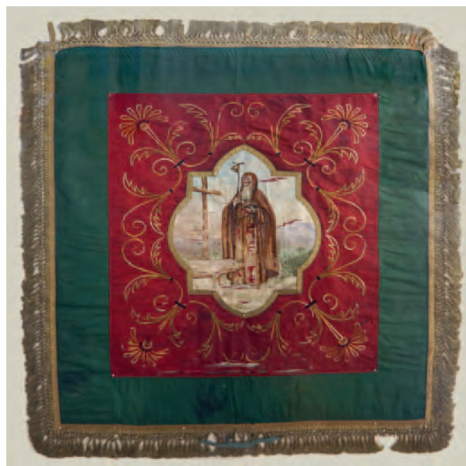
Fraai standaardvaandel van het Gilde Sint Antonius Abt uit 1928.

Eind 19 de eeuw kreeg het gilde veel concurrentie van de opkomende handboogverenigingen zoals 'Houts Welvaren'. De bevolking kreeg meer vrije tijd en ook andere 'clubs' zoals de zangvereniging, de fanfare en voetbalclubs waren begin 20 ste eeuw in trek. Toch kon het gilde zich in die tijd ook verheugen op een hernieuwde belang-