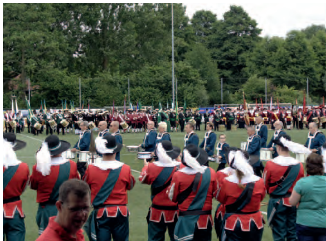
Enkele impressies van de Kringgildefeesten in 2018.