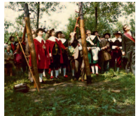
Koningschieten bij de ingebruikname van het schietterrein 'De Beemd' in 1969.

aan in onze contreien met constante dreiging van oorlog en roversbenden. Hierin kon het gilde enige bescherming bieden aan de plaatselijke bevolking. Niet dat er oorlogshandelingen gevraagd werden van het gilde, je kunt het meer zien als een politiekorps 'avant la lettre'. Om de schietvaardigheid op pijl te houden gingen men schieten de 'papegaaï', een houten vogel die bevestigd werd op een hoge paal (schutsboom) of een molenwiek.