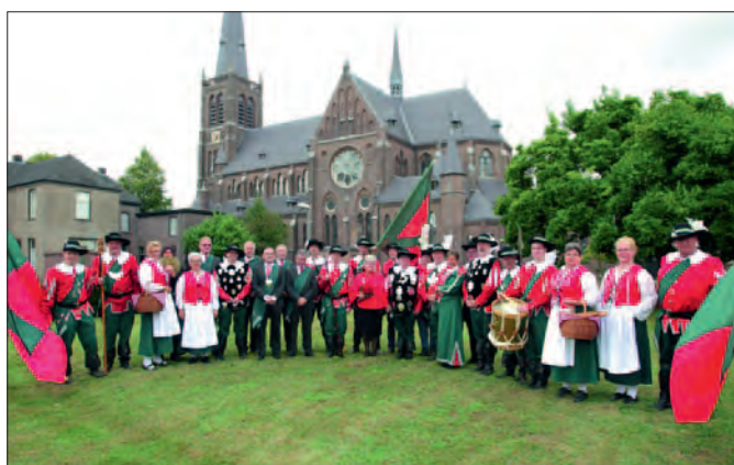
Het Gilde Sint Antonius Abt bij de Luciakerk.