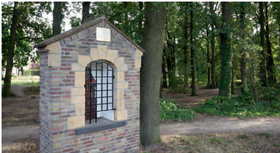
Dit weggapelletje gewijd aan Sint Antonius Abt staat in het Antoniusbosje. Het werd op 25 november 1962 ingezegend door pastoor Van Beek.

Antoniusgilde nog vierentwintig. De activiteiten bestonden voornamelijk uit het teren op de feestdag van Sint-Antonius Abt en het Koningschieten op kermis- maandag (de maandag volgend op de 1 ste zondag na 8 september).