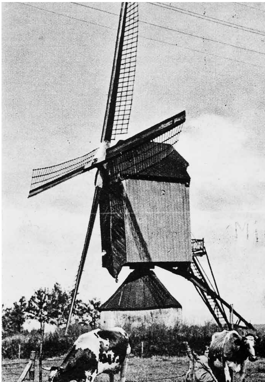
Landelijke foto gemaakt door Frans de Vries. Op de voorgrond melkt een meisje de koeien.

Je zou vermoeden dat de molen op de hoek van de Hoofdstraat en de Windmolenstraat heeft gestaan. Maar niets is minder waar. Ook in de vlakbij gelegen 'Molenwijk' zijn de straatnamen als Kastmolen, Schorsmolenpad en Korenmolen enigzins misleidend, want ook hier heeft nooit een molen gestaan. De Houtse molen stond op het perceel waar nu Aldi gevestigd is. Voorheen stonden daar de gebouwen van de Cehave (Coöperatieve Handelsvereniging).