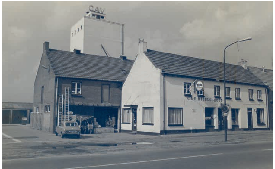
Op de locatie van de molen kwam de vestiging van C.A.V. Mierlo-Hout oftewel de Boerenbond, in de volksmond 't pakhois genoemd.